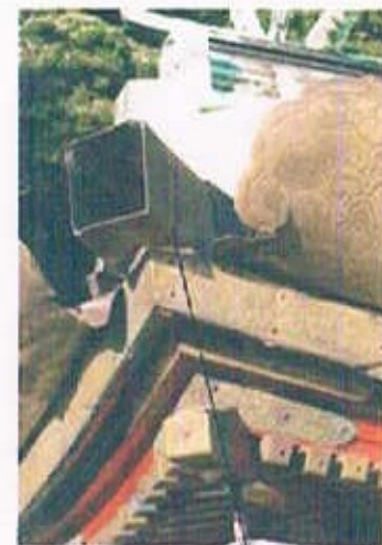
わらび手差込部 わらび手押さえ金具：新調4個