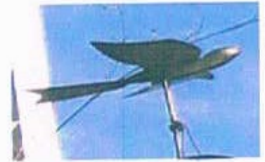
小鳥(板打ち出し胴) 形状修正、足取り付け部の補強 金鍍金、分解、組み立て