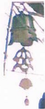
風鐺：不足部品製作、金鍍金、分解、 組み立て