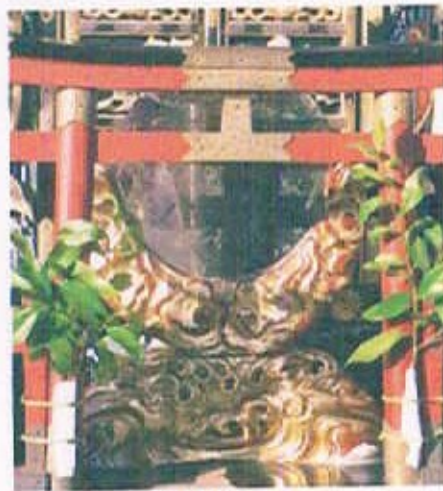
御神鏡 鏡部：再メッキ 台部：再金箔押し