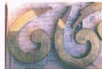
木芯・金属張りワラビ手：グラつき多い