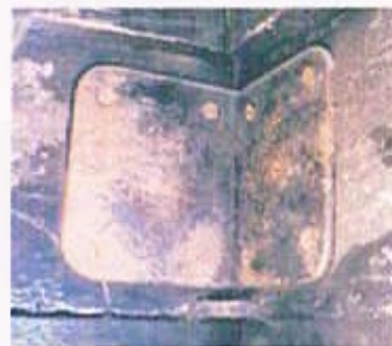
台輪裏側角：L型金具にて補強済み