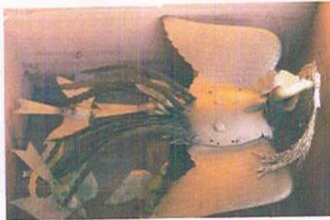
鳳凰(板打ち出し胴)：形状修正、足取り付け部の補強 金鍍金、分解、組み立て